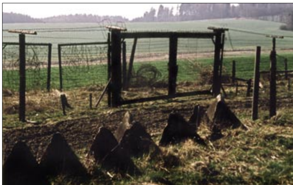
Jaro 1990 – torzo jedné z bran do svobodného světa na Všerubsku po sametové revoluci.