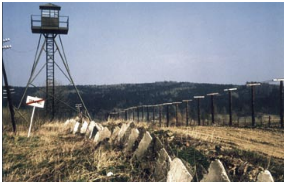
Železná opona probíhající podél hranice v okolí Všerub na Domažlicku budovaná velmi důmyslným způsobem postupně od 50. let – prázdné strážní věže a zábrany z ostnatého drátu budou již brzy odstraněny.