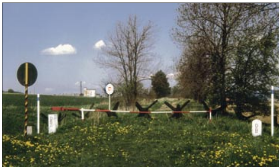
Hraniční přechod Všetřuby-Neuaig/Eschlkam před rokem 1990 (pohledem z německé strany na Všetřuby) zcela zarostlý trávou, stromy a keři – dnes tudy vede pohodlná asfaltová silnice.