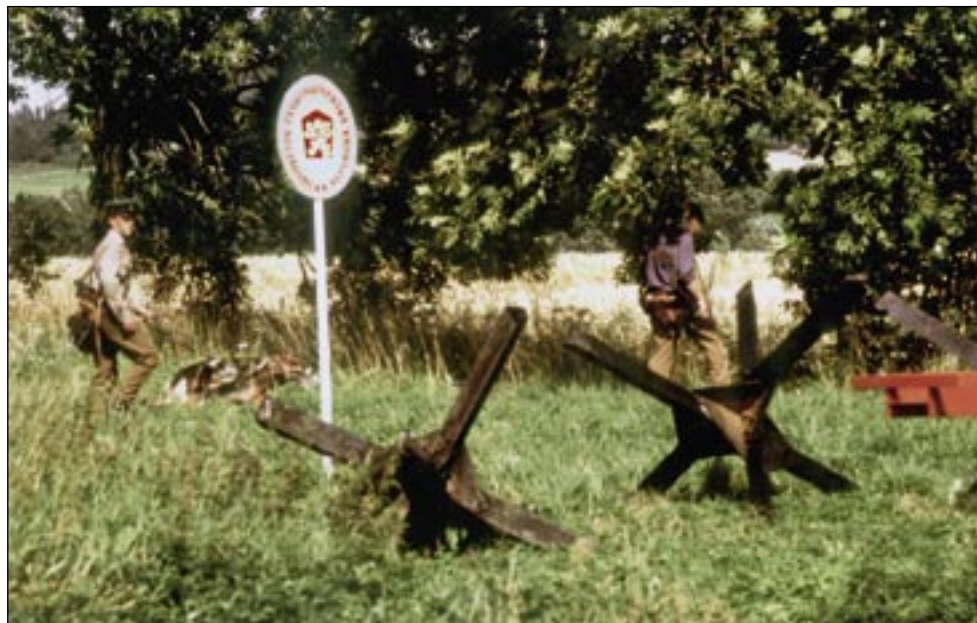
Všetřuby 1988 – pohraniční stráž se psím doprovodem na pravidelné obhlídce uzavřených hranic. Realita železné opony dotváří obrázek Evropy.