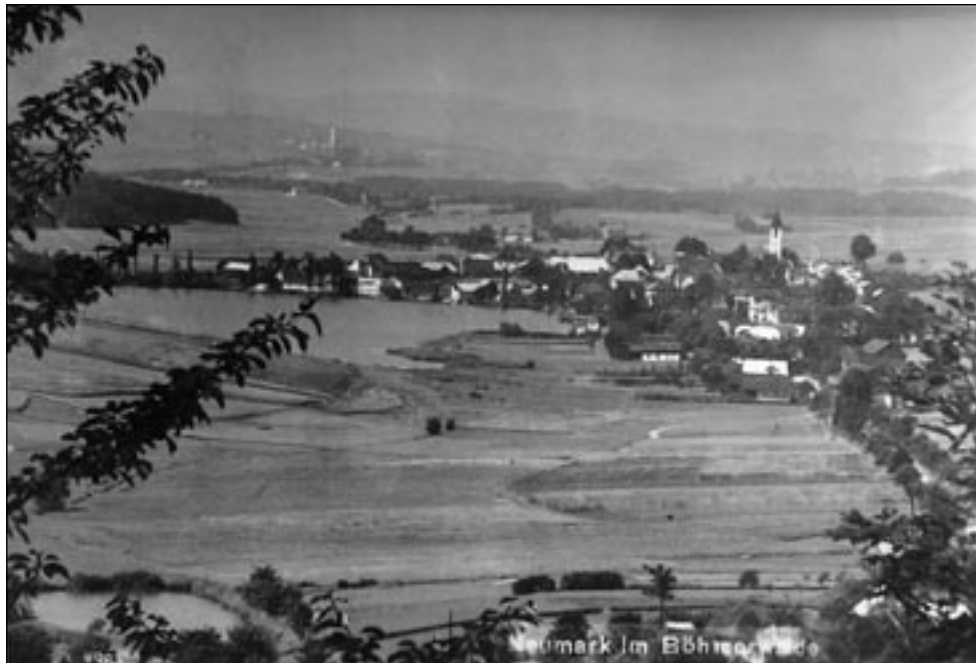
Foto: Anton Singer – Ernst Körner: 400 Jahre Stadtrecht Neumark im Böhmerwald – Jubiläumsausgabe (Möhle-Druck GmbH, Nördlingen, 1998)

Dnešní společnost je k totalitní minulosti čím dál tolerantnější a zároveň vzrůstají tendence k přehodnocení celospolečenského vnímání komunismu. Tato kniha si proto klade za cíl na příběhu akce KÁMEN odhalit nemorálnost komunistického režimu a připomenout alespoň některé z jeho obětí.