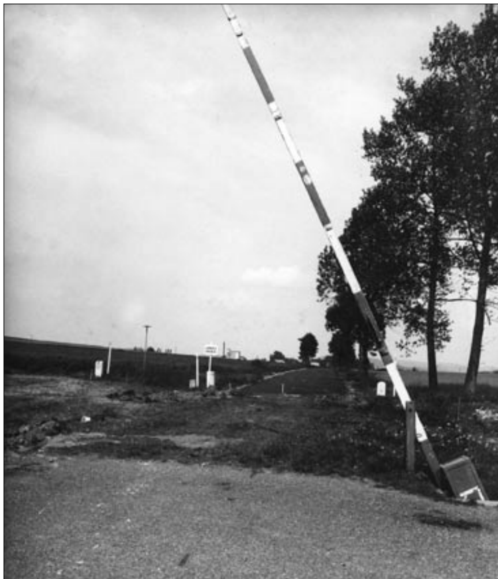
Bavorský hraniční přechod Neuaign, práce na výstavbě nové silnice před znovuotevřením přechodu 1. 7. 1990. V pozadí Všeřuby.